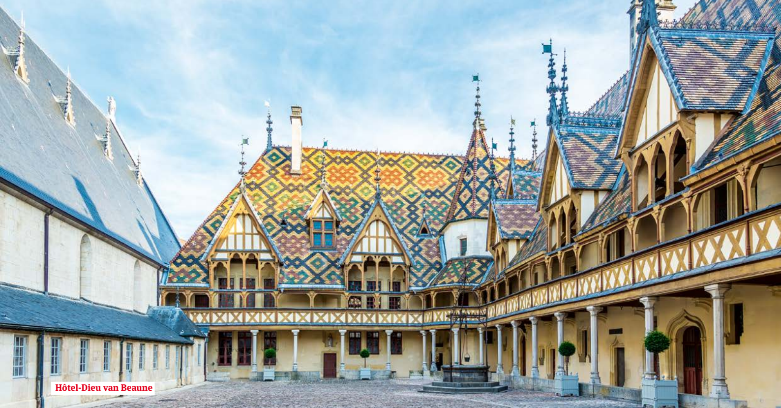
Hôtel-Dieu van Beaune