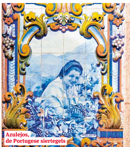
Azulejos, de Portugese siertegels

Niet ver daarvandaan ontdekken we in het stationsgebouw uit begin negentiende eeuw meer dan 20.000 tegeltjes die de geschiedenis van Portugal uit de doeken doen.