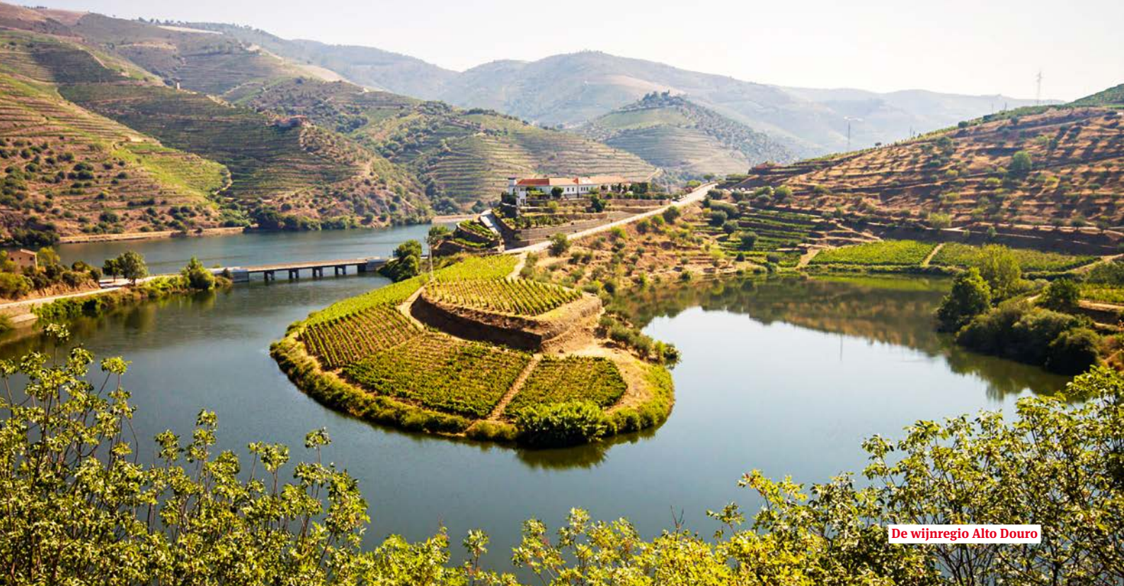
De wijnregio Alto Douro