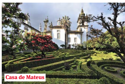
Casa de Mateus

Kort na de middag meren we aan in Régua, de poort tot de wijnregio Alto Douro (Hoge Douro), gevormd door duizenden jaren wijnbouw. Deze stad midden in de vallei was het hart van de wijnhandel in de dertiende eeuw. We bezoeken er het moderne museum van de Douro, gelegen in een oud magazijn. Het museum wil het erfgoed beschermen en promoten van de wijngebieden langs de bovenloop van de Douro, die opgenomen zijn als Unesco-werelderfgoed.