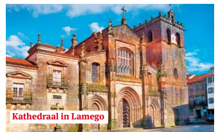
Kathedraal in Lamego

In de namiddag vertrekt u met de bus naar Porto voor een stadsbezoek. Het fraai gerestaureerde historische centrum prijkt sinds 1996 op de lijst