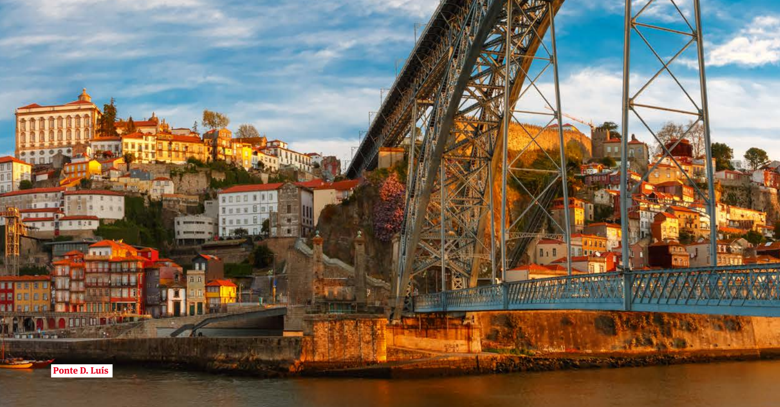
Ponte D. Luís