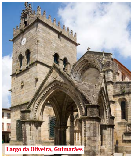
Largo da Oliveira, Guimarães

Tijd om uw koffers opnieuw in te pakken. We ontschepen na het ontbijt. Vanuit Porto wordt u naar de luchthaven vervoerd en met een lijnvlucht (met of zonder tussenlanding) vliegt u terug naar Amsterdam.