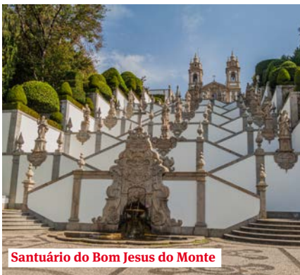
Santuário do Bom Jesus do Monte

Guimarães, ten noordwesten van Porto en de geboortestad van de eerste koning van Portugal, Afonso Henriques. De stad speelde een belangrijke rol in de onafhankelijkheid van het land en fungeerde als eerste hoofdstad.